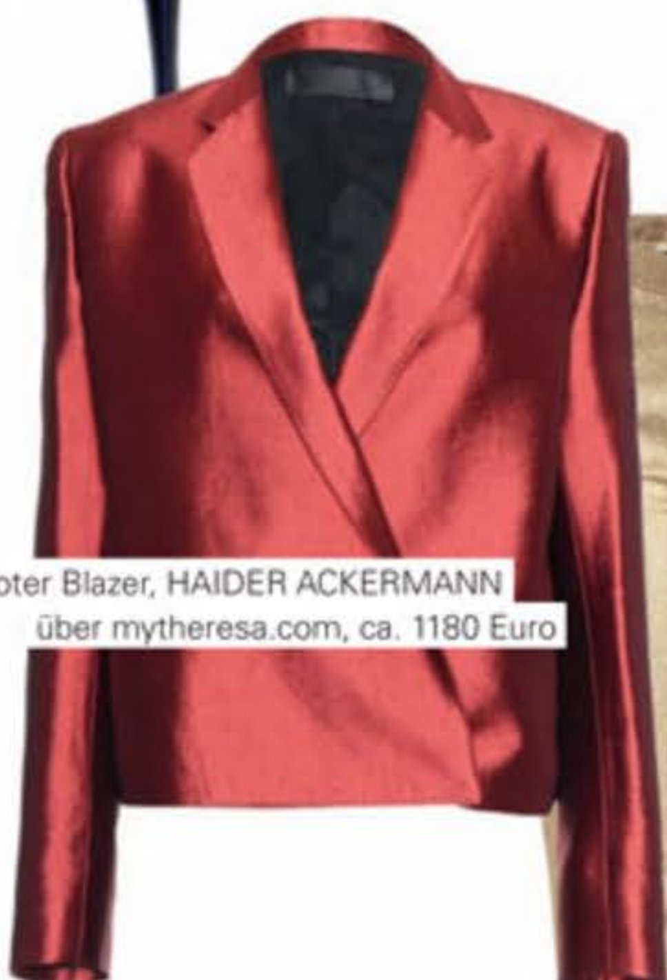
Rostroter Blazer, HAIDER ACKERMANN über mytheresa.com, ca. 1180 Euro