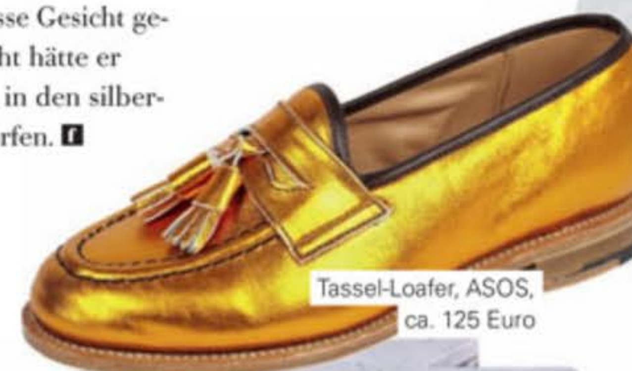
Tassel-Loafer, ASOS, ca. 125 Euro