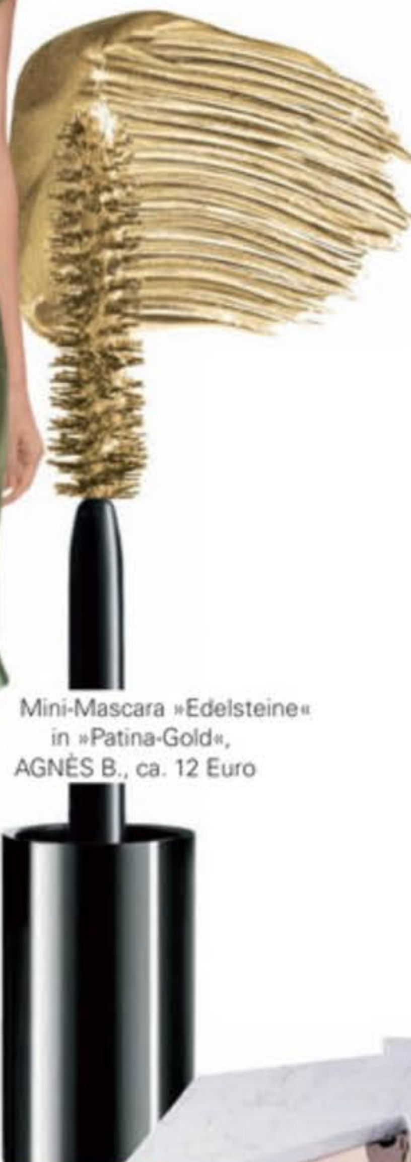
Mini-Mascara »Edelsteine« in »Patina-Gold«, AGNÈS B., ca. 12 Euro