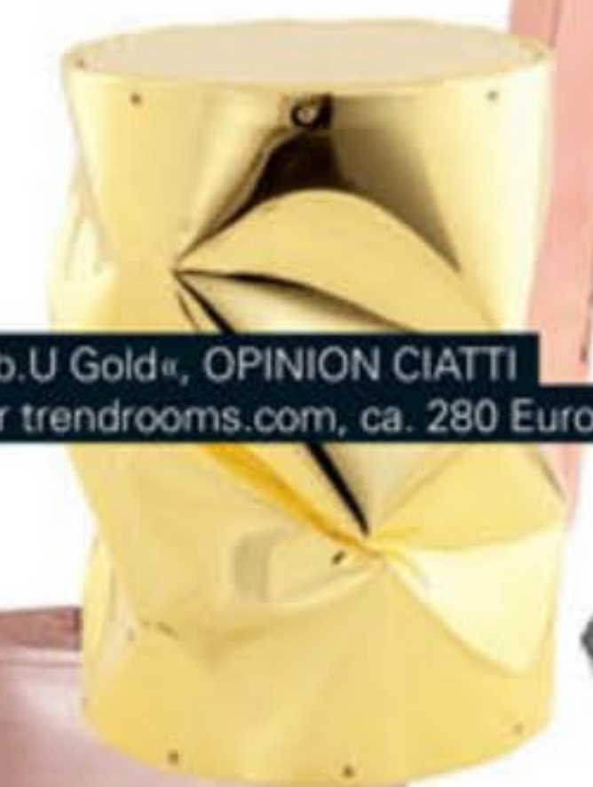
Hocker »Tab.U Gold«, OPINION CIATTI über trendrooms.com, ca. 280 Euro