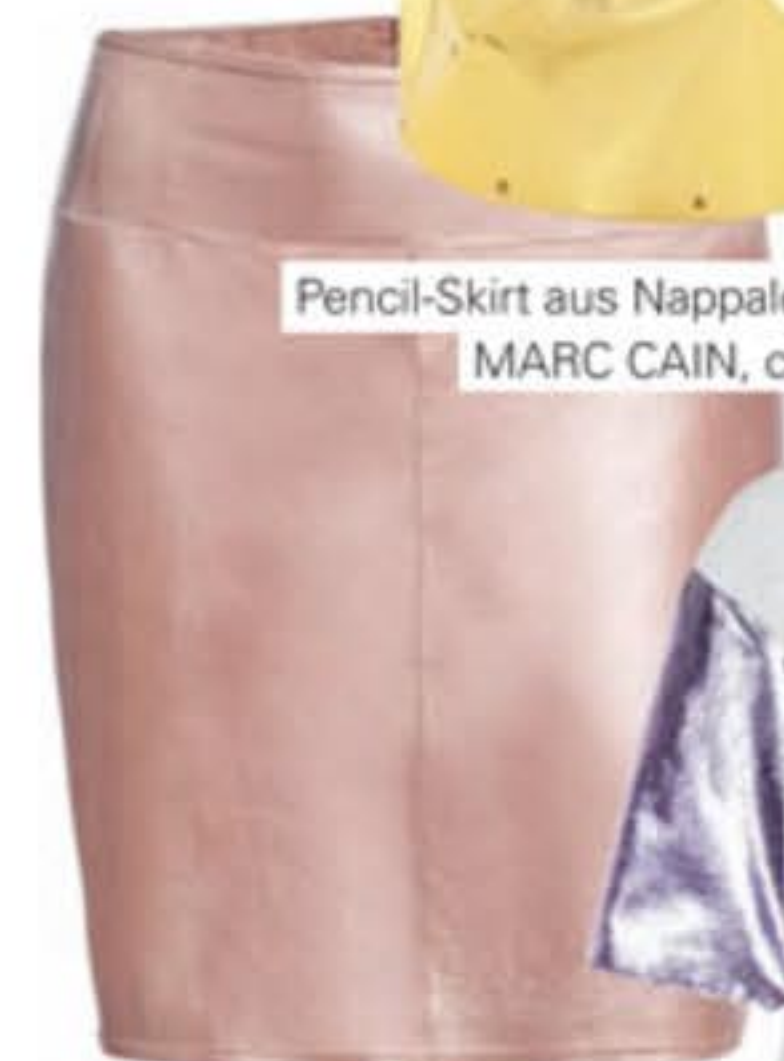
Pencil-Skirt aus Nappaleder, MARC CAIN, ca. 350 Euro