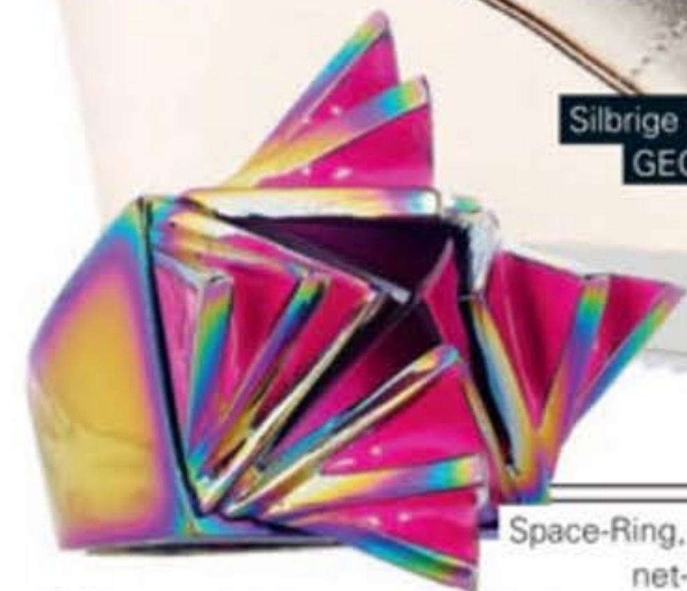
Space-Ring, EDDIE BORGIO über net-a-porter.com, ca. 465 Euro