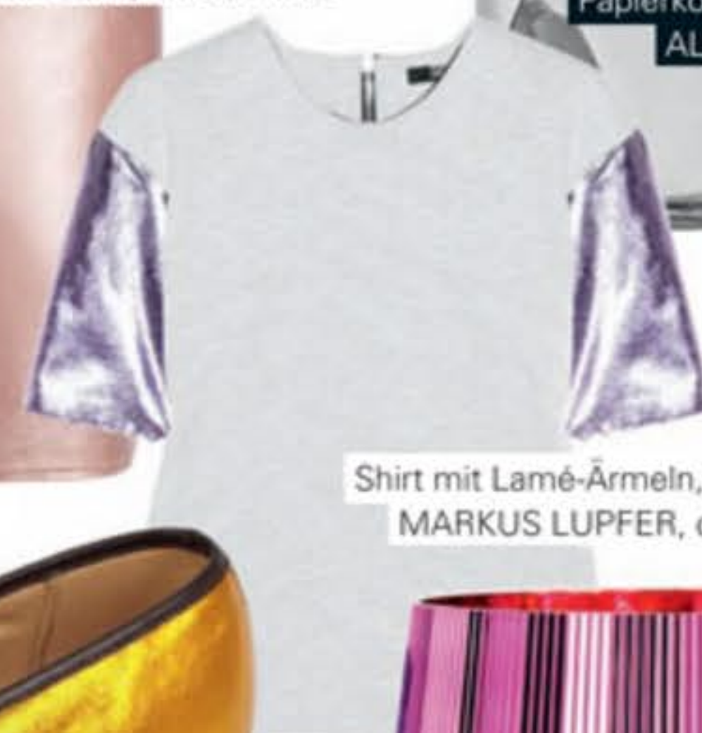
Shirt mit Lamé-Ärmeln, MARKUS LUPFER, ca. 245 Euro