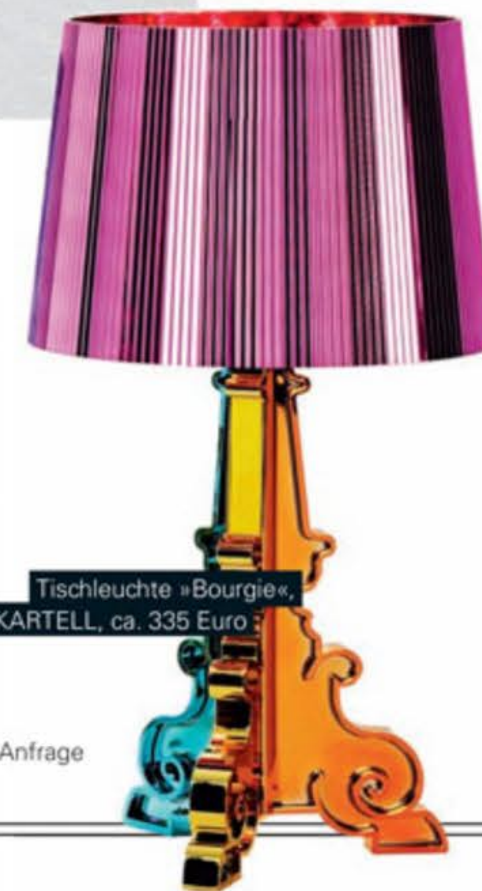
Tischleuchte »Bourgie«, KARTELL, ca. 335 Euro