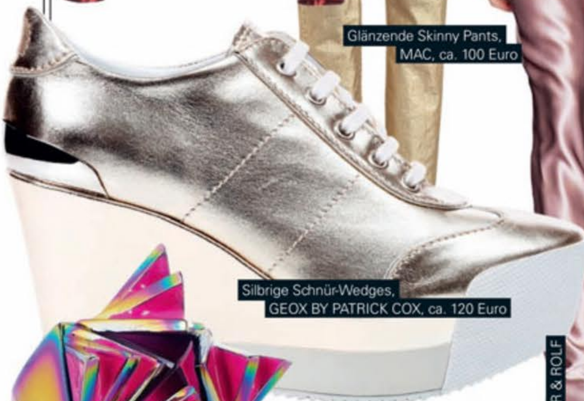
Silbrige Schnür-Wedges, GEOX BY PATRICK COX, ca. 120 Euro