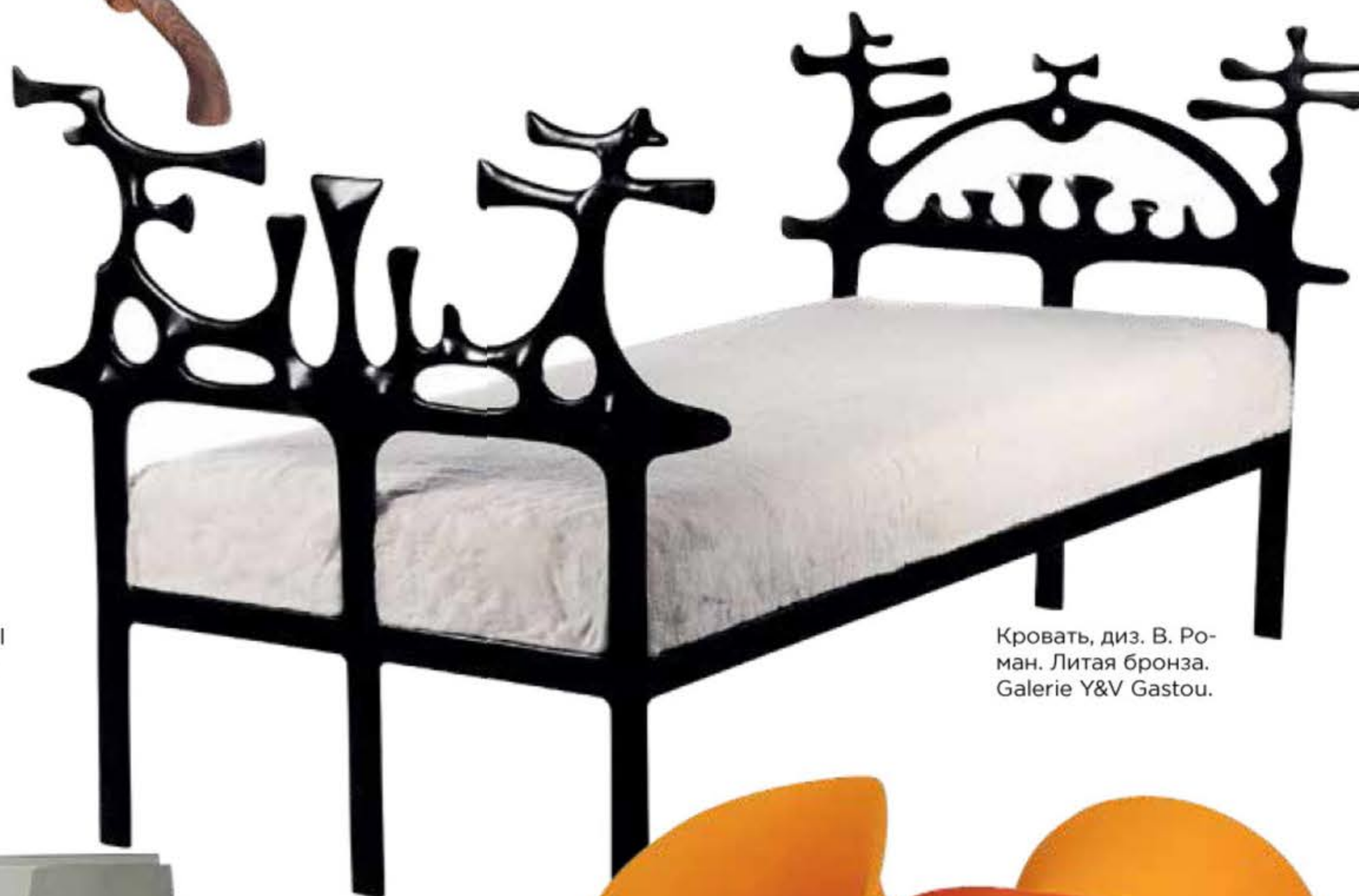
Кровать, диз. В. Роман. Литая бронза. Galerie Y&V Gastou.