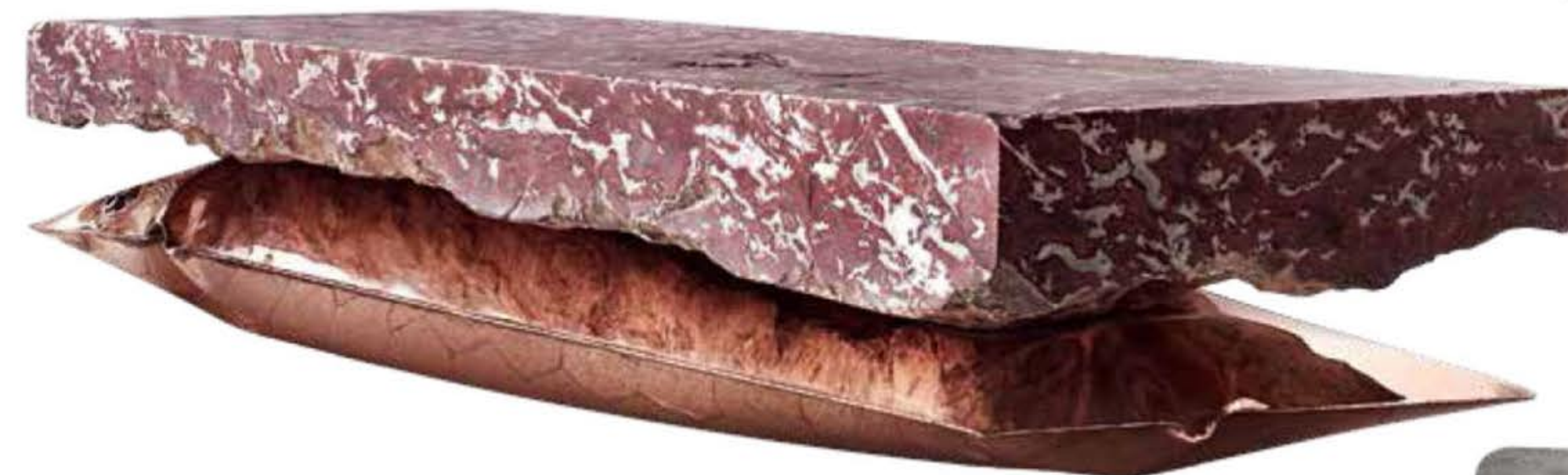
Стол, диз. Б. Стормс. Бельгийский мрамор Сент-Анн, латунь. Тираж 8 + 2 экз. + прототип. Galerie L'Eclairer.