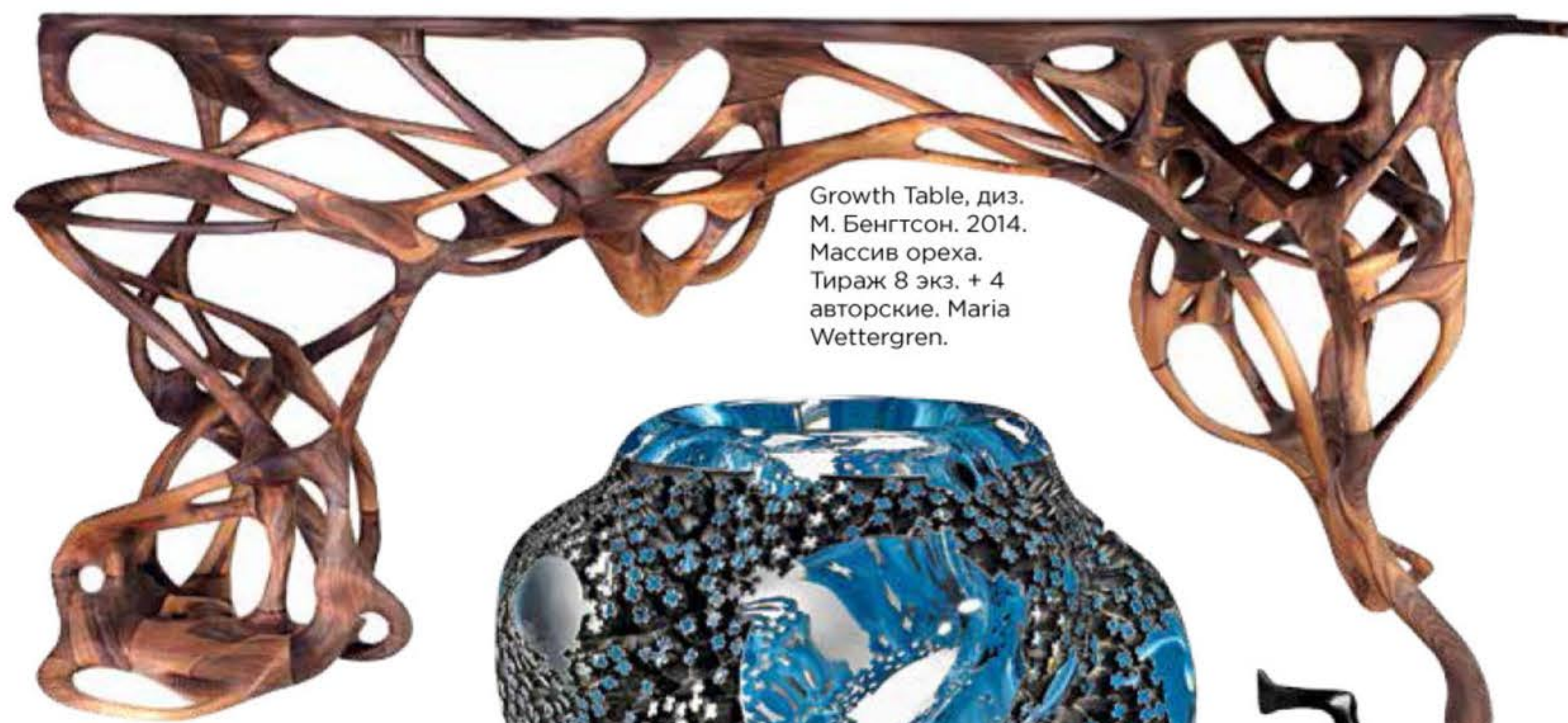
Growth Table, диз. М. Бенгтсон. 2014. Массив ореха. Тираж 8 экз. + 4 авторские. Maria Wettergren.