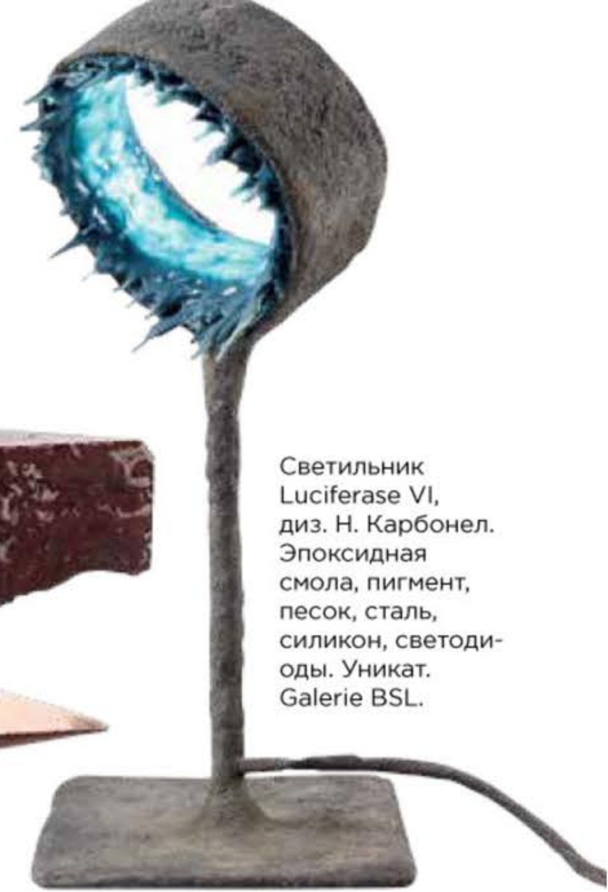
Светильник Luciferase VI, диз. Н. Карбонел. Эпоксидная смола, пигмент, песок, сталь, силикон, светодиоды. Уникат. Galerie BSL.