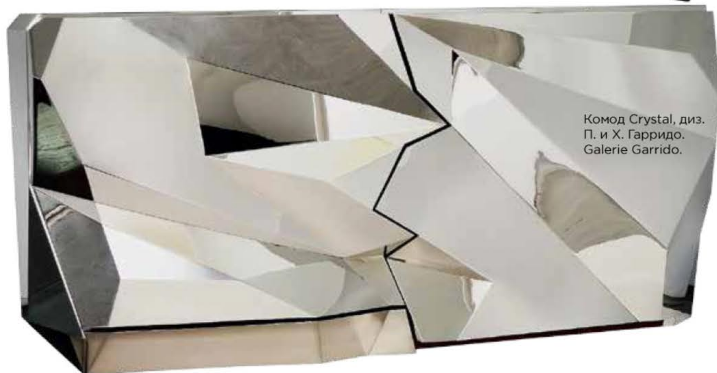
Комод Crystal, диз. П. и Х. Гарридо. Galerie Garrido.