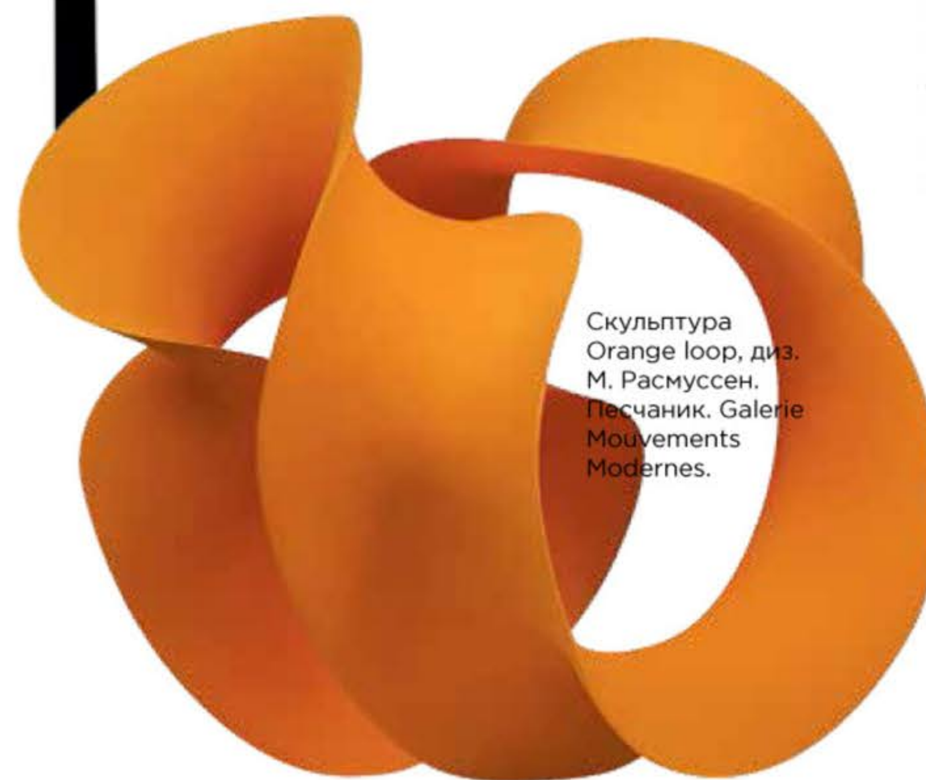
Скульптура Orange loop, диз. М. Расмуссен. Песчаник. Galerie Mouvements Modernes.