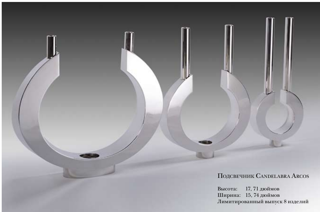
ПОДСВЕЧНИК CANDELABRA ARCOS