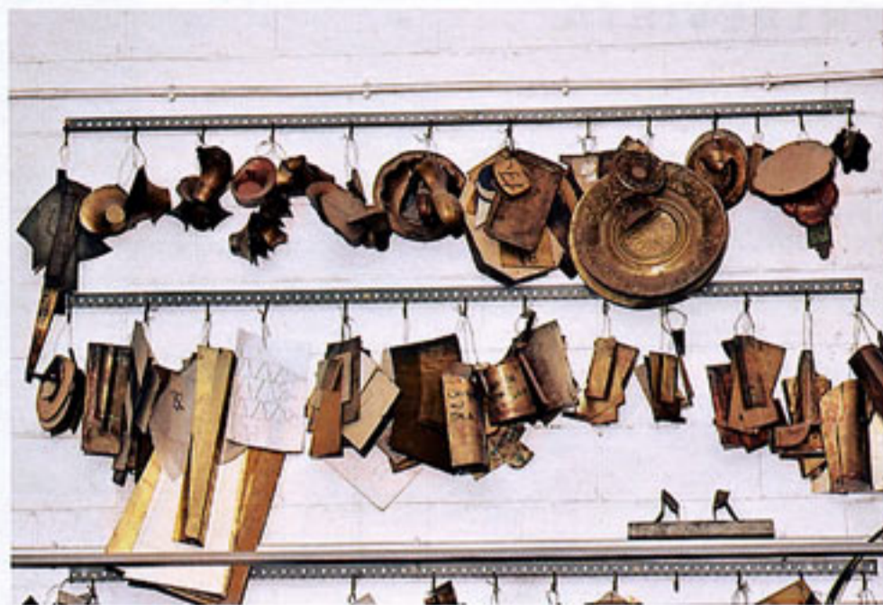
En el taller se conservan muchas de las piezas de trabajo que se usaban en los comienzos de la firma, en los años 60.