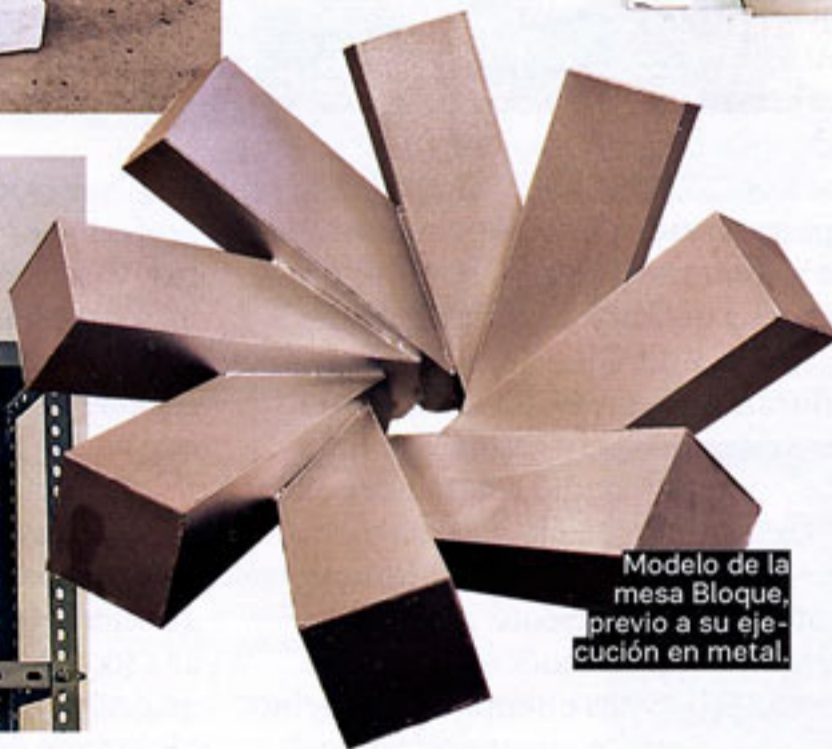
Modelo de la mesa Bloque, previo a su ejecución en metal.