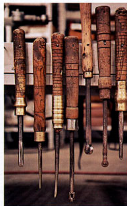
Estos buriles sirven para entallar las piezas. Las técnicas de trabajo siguen siendo las mismas que se empleaban en el siglo XIX.