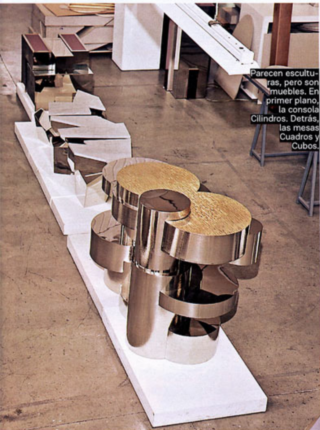
Parecen esculturas, pero son muebles. En primer plano, la consola Cilindros. Detrás, las mesas Cuadros y Cubos.