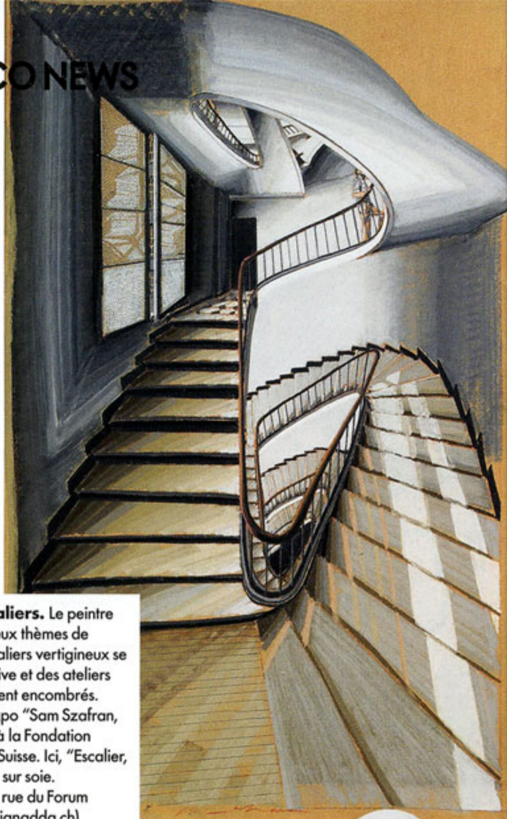
L'homme des escaliers. Le peintre Sam Szafran avait deux thèmes de prédilection : des escaliers vertigineux se jouant de la perspective et des ateliers surréalistes franchement encombrés. A (re)découvrir à l'expo "Sam Szafran, 50 ans de peinture", à la Fondation Pierre Gianadda, en Suisse. Ici, "Escalier, 1991-1992", aquarelle sur soie. (Du 8 mars au 16 juin, rue du Forum 59, Martigny. www.gianadda.ch )

Télex / Du 15 au 24 mars, la prestigieuse foire de l'art, des antiquités et du design Tefaf s'installe à Maastricht. ( www.tefaf.com )