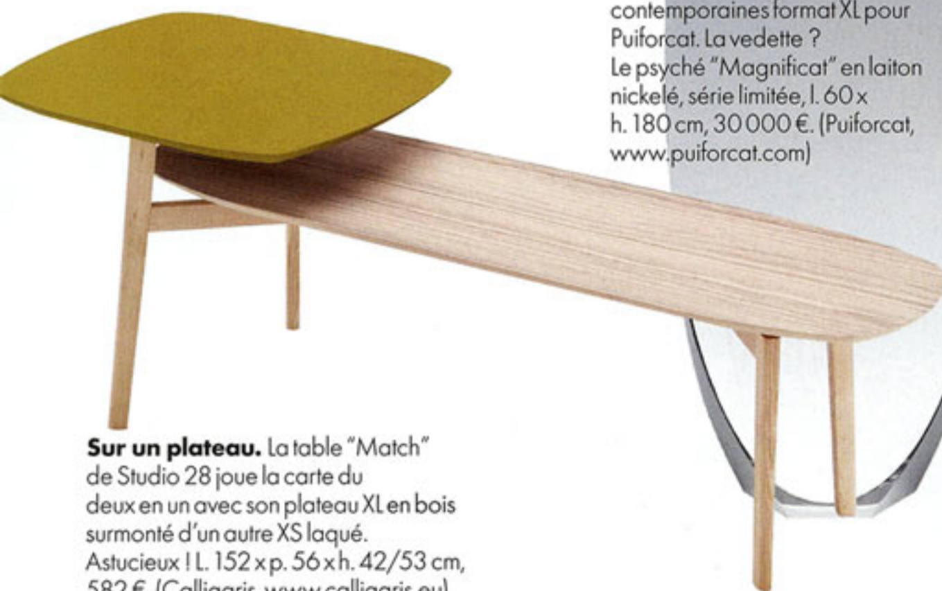
Sur un plateau. La table "Match" de Studio 28 joue la carte du deux en un avec son plateau XL en bois surmonté d'un autre XS laqué. Astucieux ! L. 152 x p. 56 x h. 42/53 cm, 582 €. (Calligaris, www.calligaris.eu )

Télex / Du 15 au 24 mars, la prestigieuse foire de l'art, des antiquités et du design Tefaf s'installe à Maastricht. ( www.tefaf.com )