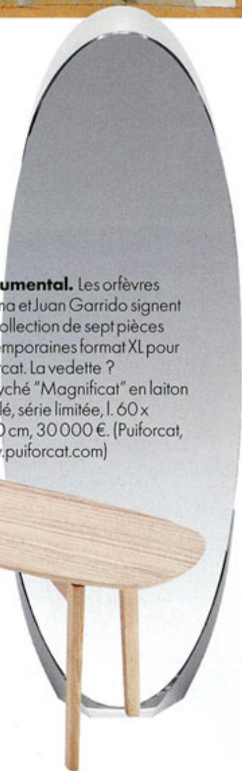
Monumental. Les orfèvres Paloma et Juan Garrido signent une collection de sept pièces contemporaines format XL pour Puiforcat. La vedette ? Le psyché "Magnificat" en laiton nickelé, série limitée, l. 60 x h. 180 cm, 30 000 €. (Puiforcat, www.puiforcat.com )